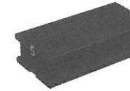
アシストスツール (品番:ASS-V) (写真3)