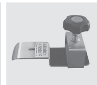
アシストペダル (例) 【出場者・付添者にてご持参ください】