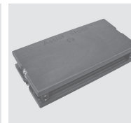
足台 (例) 【出場者・付添者にてご持参ください】